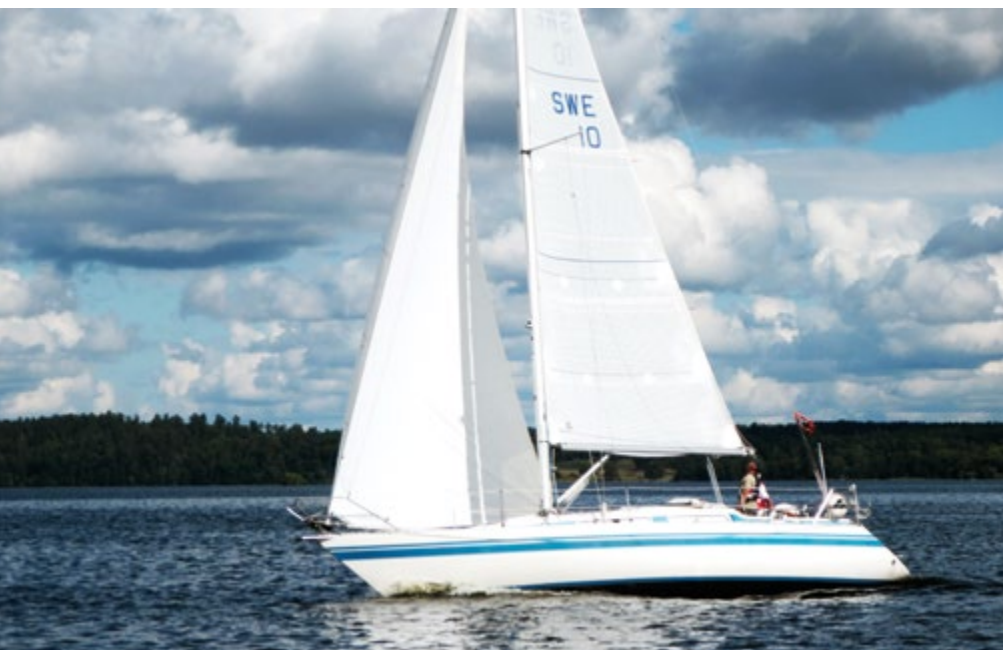
Fin gång vid Höstkvartern 2016.