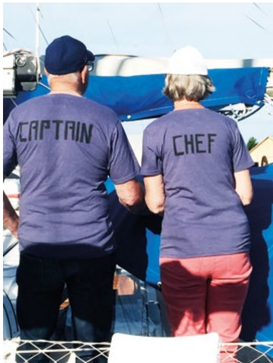
6-timmarsseglingen förbereds grundligt.

Att det kan vara så här stor spridning på båtarna och deltagarna, många seglar ensamma, visar hur flexibel tävlingsformen är. Loggboken kan som